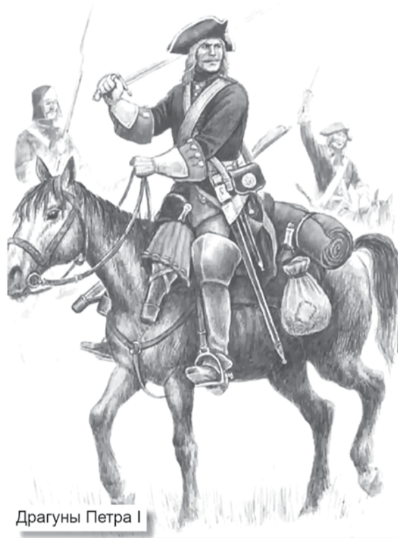
Драгуны Петра I

В феврале 1706 года шведская армия под командованием Карла Густава Реншильда одержала знаменитую победу под Фрауштадтом (ныне Вшов в 90 километрах к северо-западу от Вроцлава), где 10 тысяч шведов разгромили 18 тысяч саксонцев и русских. Эта победа оценивается как одна из самых блестящих в истории шведской армии. Она же может быть названа и самым грязным пятном позора на мундире шведского солдата.