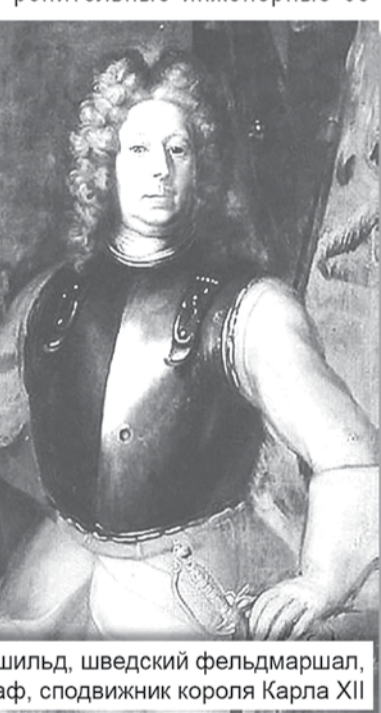
Карл Густав Реншильд, шведский фельдмаршал, граф, сподвижник короля Карла XII

оружия и заграждения, отремонтированы крепости на линии Киев – Брянск – Смоленск – Псков. Жители призывались прятать хлеб и уходить в леса с имуществом и скотом, защищаясь от врага с оружием в руках. Борьба против шведского нашествия должна была приобрести характер войны за национальную независимость с участием не только армии, но и всего народа.