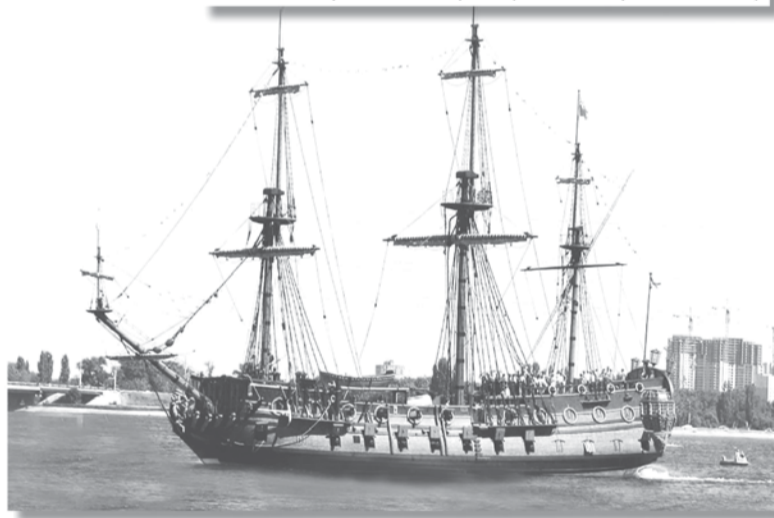
Первый российский линейный корабль (реплика) «Гото Предестинация» («Божье провидение»)