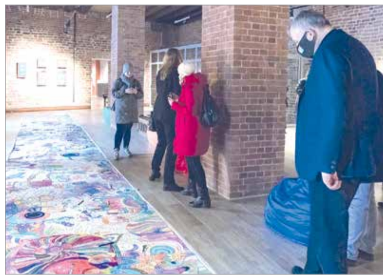
«Реку жизни» в Выборге оценил Александр Дрозденко

• В ЛОДЕЙНОПОЛЬСКОМ ТЕХНИКУМЕ ПРОМЫШЛЕННЫХ ТЕХНОЛОГИЙ