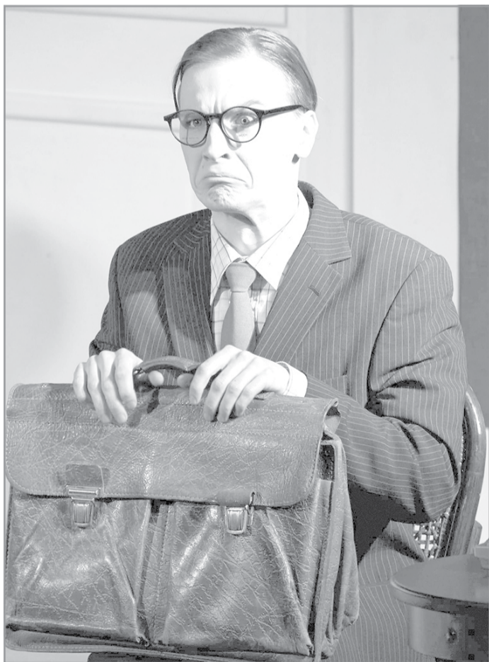
Невероятное перевоплощение в Джорджа Пигдена («Она, она, окно, покойник»)

Роман: «Дарованиями» это сложно назвать. Скорее, навыки на начальном этапе развития. Английским я не владею, просто знаю, о чем пою. На гитаре я научился играть ещё в студенчестве. На трубе при желании можно научиться играть в разы лучше, чем я.