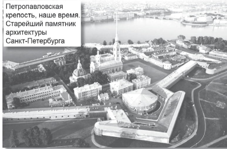
Петропавловская крепость, наше время. Старейший памятник архитектуры Санкт-Петербурга

пленными; русские – 350 человек убитыми, свыше 1 300 человек ранеными.